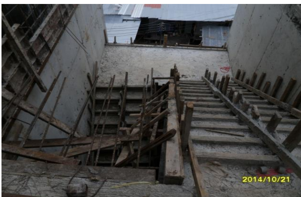
รูปที่ 3. งานหล่อคอนกรีตบันได ST-1 ชั้นที่ 2 ขึ้นชั้นที่ 3