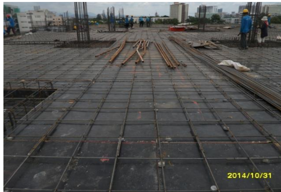
รูปที่ 5. งานผูกเหล็กพื้นชั้นที่ 4