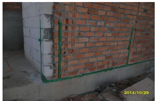
รูปที่ 12. งานเดินท่อน้ำดีภายในห้องน้ำ