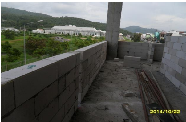
รูปที่ 9. งานก่ออิฐผนังชั้นที่ 2