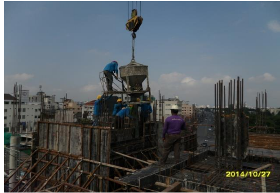
รูปที่ 4. งานเทคอนกรีตผนังลิฟต์