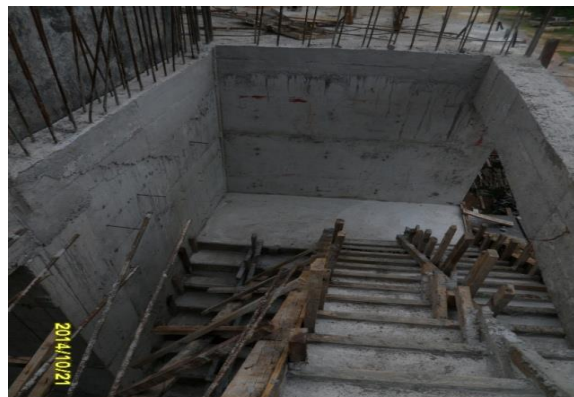
รูปที่ 6. งานหล่อคอนกรีตบันได ST-2 ชั้นที่ 2 ขึ้นชั้นที่ 3