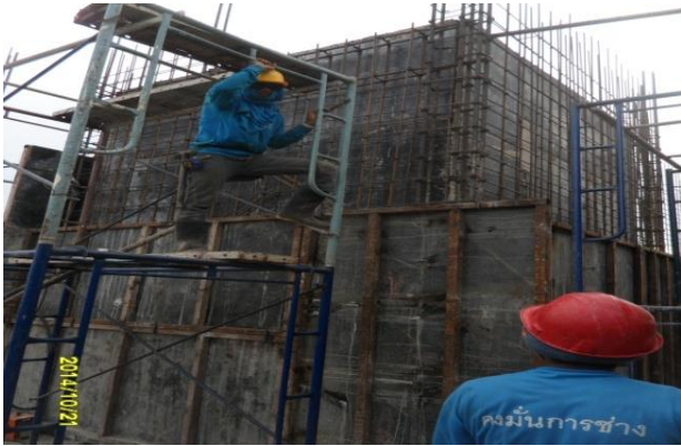
รูปที่ 1. งานผูกเหล็กเข้าแบบผนังลิฟต์