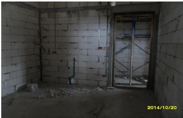
รูปที่ 8. งานเดินท่อไฟฟ้า ท่อประปา ชั้นที่ 1