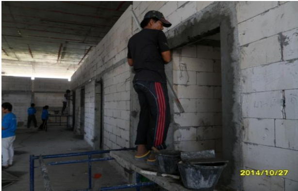
รูปที่ 7. งานจับเชื่อมวงกบประตูห้องตรวจ ชั้นที่ 1