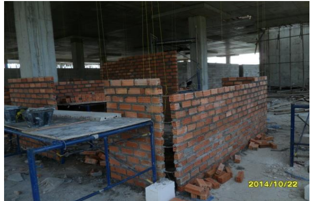
รูปที่ 10. งานก่ออิฐผนังชั้นที่ 2