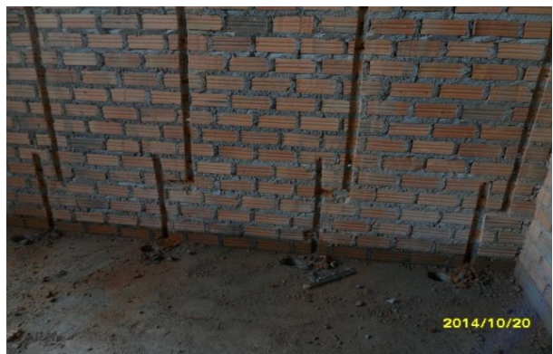
รูปที่ 11. งานสกัดผนังวางท่อน้ำดีภายในห้องน้ำ