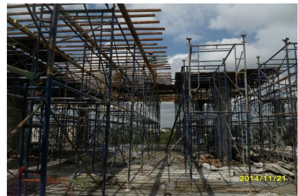
รูปที่ 11. งานตั้งนั่งร้านรับแบบพื้นชั้นคาคฟ้า