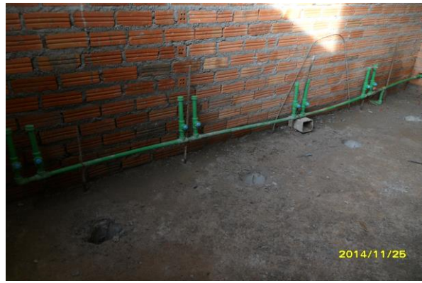
รูปที่4.งานเดินท่อน้ำดีห้องน้ำชั้นที่2