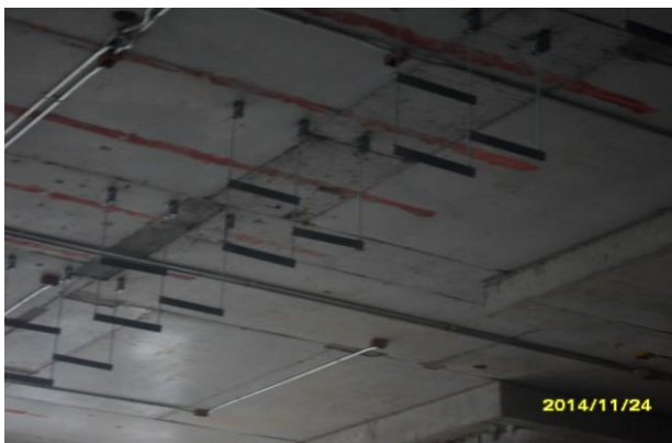
รูปที่3. งานติดตั้งอุปกรณ์ยึดราง wire way