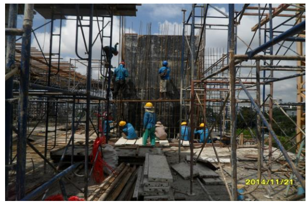
รูปที่ 12. งานผูกเหล็กผนังลิฟท์ชั้นที่ 4