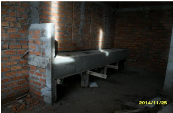
รูปที่ 8. งานแคนเตอร์ห้องน้ำชั้นที่ 1