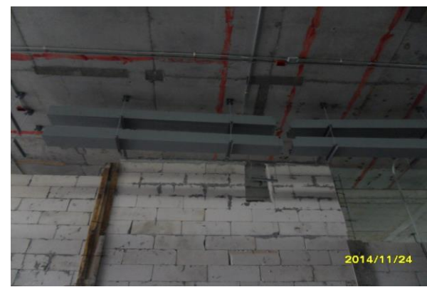
รูปที่6. งานติดตั้งราง wire way