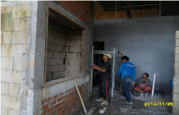
รูปที่1. งานจับเชื่อมผนังชั้นที่1