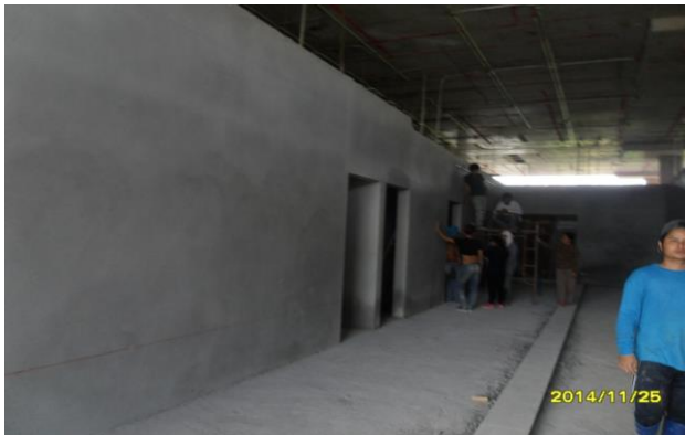
รูปที่2. งานฉาบผนังชั้นที่1