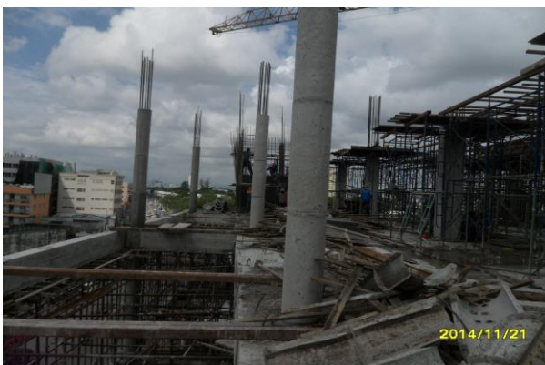
รูปที่ 9. งานเสารับพื้นชั้นคาคฟ้า