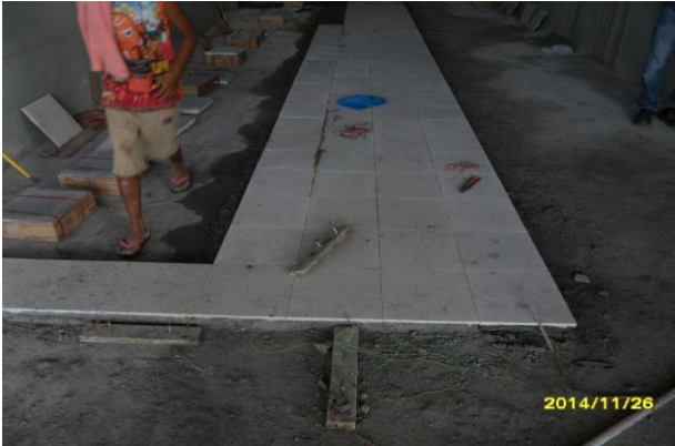
รูปที่ 7. งานปูกระเบื้องหินขัดสำเร็จรูปโคงทางเดินชั้นที่ 1