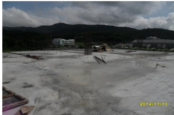
รูปที่ 10. งานพื้นชั้นที่ 4