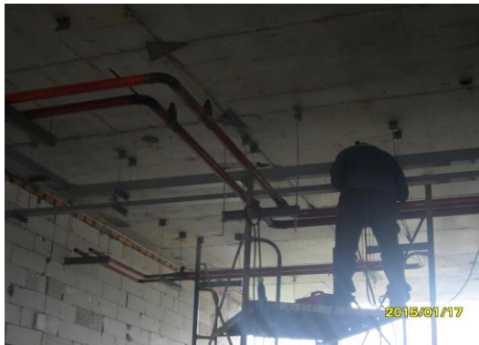
รูปที่2. งานเชื่อมน้ำทิ้งแอร์ชั้น 4