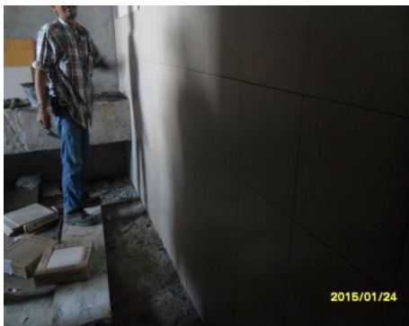
รูปที่2. งานปูกระเบื้องผนังห้องน้ำ ชั้น 2