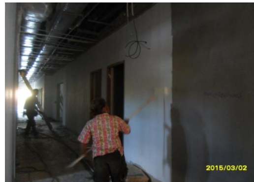
รูปที่6. งานทาสีรองพื้น ชั้น 1