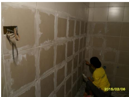
รูปที่3. งานขานแนวกระเบื้องผนังห้องน้ำ ชั้น 2