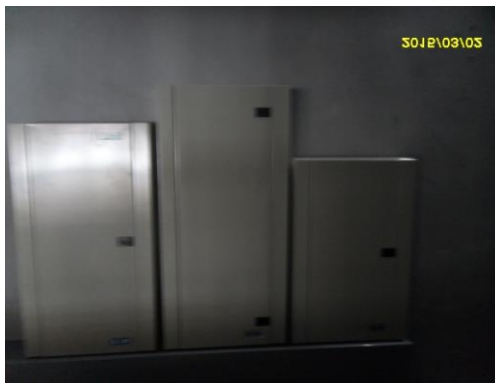
รูปที่2. งานติดตั้งตู้ MDB ห้องไฟฟ้าทุกชั้น