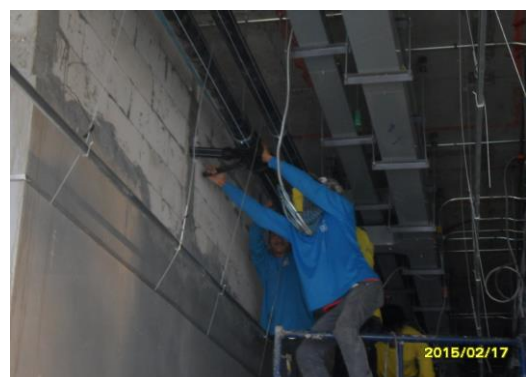
รูปที่6. งานเดินท่อน้ำทิ้งจากห้องปฏิบัติการ