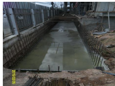
รูปที่6. งานเทคอนกรีตพื้น Block convert