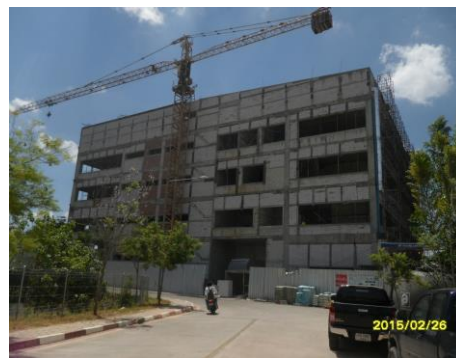
รูปที่5. งานภาพรวมของงานก่ออิฐ