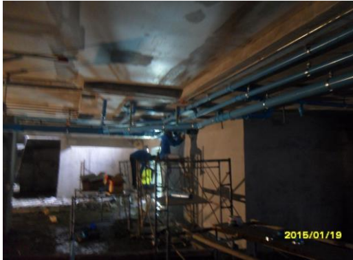
รูปที่1. งานหุ้มฉนวนท่อน้ำทิ้งแอร์ ชั้น 3