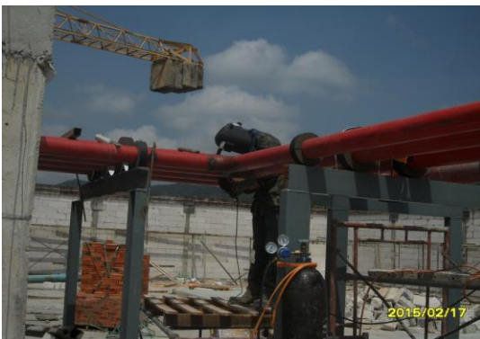
รูปที่3. งานเชื่อมต่อแอร์ ชั้น ดาดฟ้า