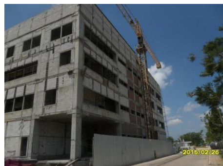
รูปที่6. งานภาพรวมงานก่ออิฐ