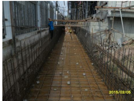
รูปที่5. งานผูกเหล็กพื้นผนังBlock convert