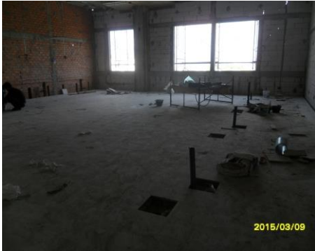
รูปที่1. งานปูพื้นหินขัด ชั้น 4