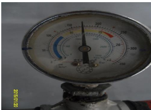
รูปที่3. งานทดสอบน้ำที่ห้องเครื่อง ชั้น 4