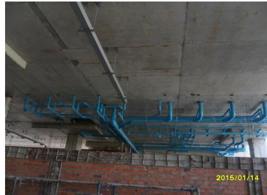
รูปที่5. งานเดินท่อสุขาภิบาล ชั้น 4