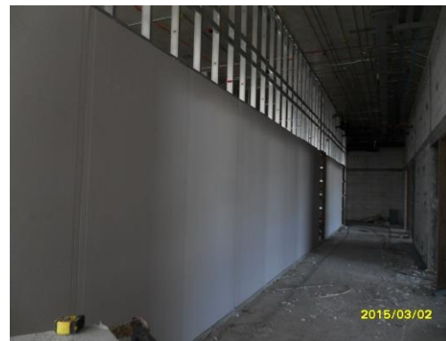
รูปที่5. งานยิงแผ่นผนังเบา ชั้น 3