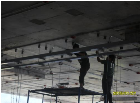
รูปที่1. งานเดินท่อร้อยสายไฟฟ้า ชั้น 4