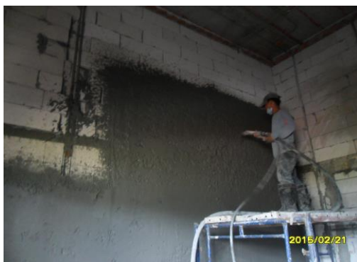
รูปที่3. งานฉาบปูนผนังห้องผ่าตัด ชั้น 2