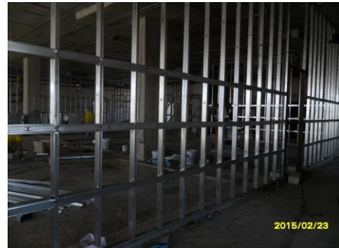
รูปที่4. งานโครงผนังเบา ชั้น 3