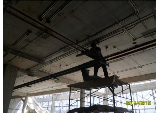
รูปที่4.งานเดินท่อเชื่อมต่อท่อน้ำทิ้ง ชั้น 1