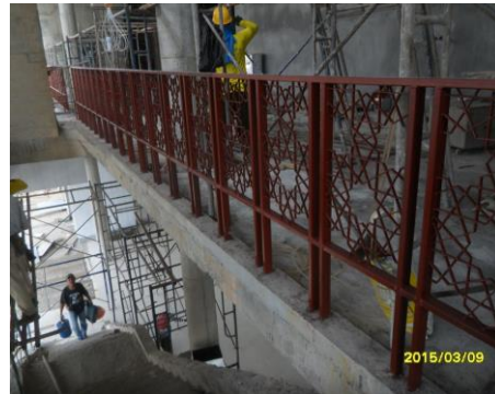
รูปที่4.งานติดตั้งราวบันได ชั้น 2