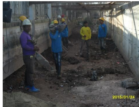
รูปที่4. งานขุดดินทำBlock convert